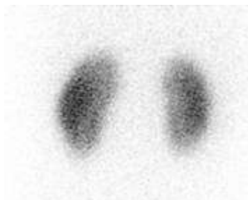
Στατικό σπινθηρογράφημα νεφρών (Οπίσθια λήψη - Φυσιολογικό).

Για τη διαφοροδιάγνωση ηπατοκυτταρικής βλάβης ή αποφράξεως ή ατρησίας χοληφόρων.