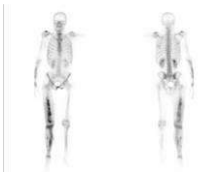
Στατικό σπινθηρογράφημα οστών με Tc99m-MDP